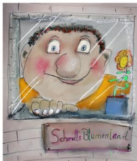
Der Riese Schmoll Kinderstück von Peter Futterschneider

Die beiden Riesen Groll und Schmoll bewachen einen Obstbaum und vertreiben alle Menschen, die gern davon naschen möchten. Schmoll mag aber eigentlich nicht böse sein. Er würde sich viel lieber um bunte, duftende Blumen kümmern. Eines Tages hat Schmoll genug und läuft davon. Auf einer wunderschönen Blumenwiese findet er mit dem Mädchen Julia und dem jungen Schneider Tom neue Freunde. Mit deren Hilfe möchte sich Schmoll einen Traum erfüllen: Einen eigenen Blumenladen in der Stadt. Doch auf dem Weg zu diesem Traum gibt es Hindernisse zu überwinden: Der König verbietet den Riesen jeden Handel in der Stadt. Inzwischen sucht Groll seinen alten Freund und vergisst dabei, dass er eigentlich ein grolliger Riese ist. Die Menschen lernen ihn von seiner guten Seite kennen. Bald bekommt er mit der Wache des Königs tatkräftige Hilfe bei der Suche nach Schmoll. Prinzessin Klara bringt einige Turbulenzen in diese Geschichte, die natürlich ein glückliches Ende nimmt.