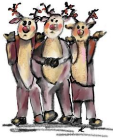
Drei Rentiere und kein Weihnachtsmann Märchen und Familientheaterstück von Peter Futerschneider

Die Rentiere Ralf, Richard und Rita sind aus ihrem Jahresurlaub zurückgekehrt und warten wie jedes Jahr am Treffpunkt auf den Weihnachtsmann, um gemeinsam für die große Bescherung zu trainieren. Doch sie warten vergebens. Außer ein paar Schülern, die sich über den Beginn der Herbstferien freuen, ist niemand zu sehen. Schnell dämmert den drei Rentieren, dass es in diesem Jahr zu Weihnachten keine Bescherung geben wird, wenn es ihnen nicht gelingt, das Geheimnis ihres verschwundenen Chefs zu lösen. Auf der Suche nach dem Weihnachtsmann bekommen die Rentiere tatkräftige Unterstützung von Frieda, Lara und Nils und von einem gewissen Obo, der von sich behauptet, der Oberosterhase zu sein. Es gilt, eine Menge Abenteuer zu überstehen und dabei ist völlig offen, ob die Suchaktion am Ende zum Erfolg führen wird.